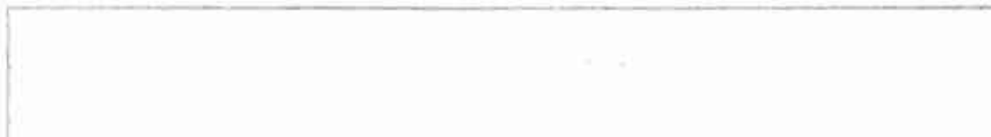
Image in higher resolution (742 × 726 pixel, file size: 50 KB, MIME type: image/png)